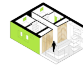
Bostad för fyra studenter på 40 kvadratmeter