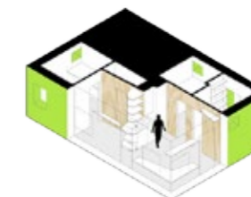
Bostad för tre studenter på 30 kvadratmeter