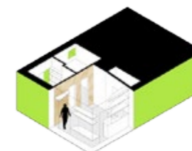
Bostad för två studenter på 20 kvadratmeter